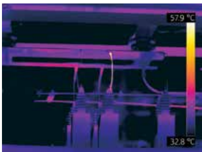
Trasformatore surriscaldato di un elettrodotto